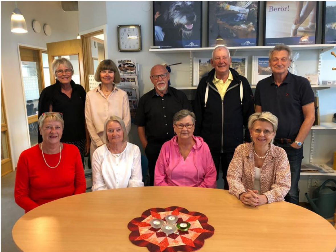
Styrelse Aktiva Seniorer, Ystad